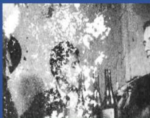
COLOMBIA LINDA, 1955