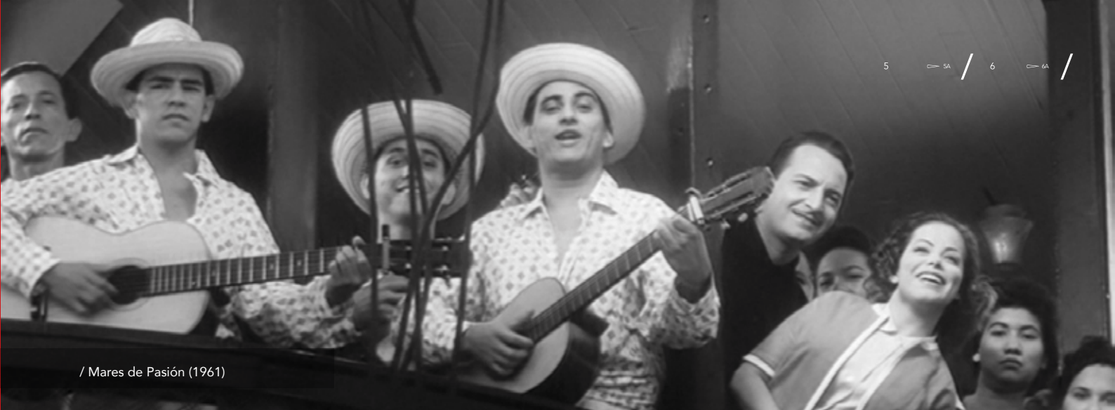
/ Mares de Pasión (1961)