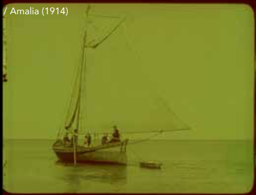
/ Amalia (1914)