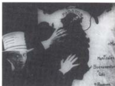
Colombia. Garras de Oro , 1926. Dirigida por P.P. Jambrina.

Producción: Cali Films, Cali, 1926. 35 mm. b/n 45 min. Dirección: P.P. Jambrina. Cámara: Arnaldo Ricotti y Arrigo Cinotti. Restaurada por la Fundación Patrimonio Fílmico Colombiano.