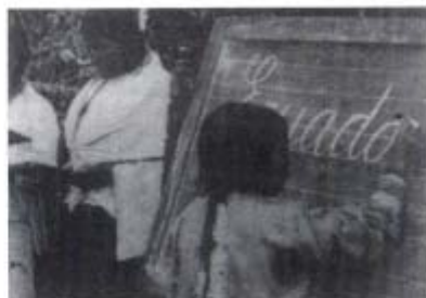
Ecuador. "La raza indígena se educa", del Noticiero Ocaña Film , 1929. Dirigida por Manuel Ocaña.

Año de realización: 1929. Año de restauración: 1989. Duración: 23 min. Productor: Ocaña Film. Realizador: Manuel Ocaña, 35 mm., b/n, Silente.