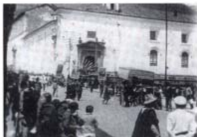
Ecuador. " Paseo de banderillas para anunciar corridas de toros" en Miguel Angel Alvarez, fragmentos obra fílmica, 1922- 35.

Año de realización: 1927-1935. Años de restauración: 1989-1995 Duración: 7 min. (fragmentos). Productor: Miguel A. Alvarez. Realizador: Miguel A. Alvarez. 35 mm., b/n, Silente.