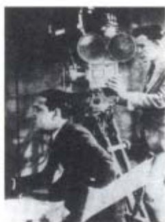
Cuba. Ramón Peón dirige La Virgen de la Caridad , 1930.

despojar a Yeyo de su finca, y de su amor. Cuando está a punto de lograrlo, Nicomedes, dueño de la casa donde se han tenido que refugiar Yeyo y su abuela, se dispone a colgar un cuadro. La abuela le indica a Yeyo que se hinque y le pida ayuda a la Virgen de la Caridad. Cuando el dueño de la casa golpea la pared, cae la imagen de la Virgen; en su interior están las escrituras, con lo que, justo a tiempo, se salva la propiedad y la amada, ya que Trini estaba a punto de ser casada por la fuerza con el malvado Fernández.