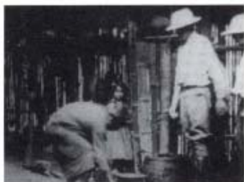
Ecuador. Los invencibles Shuaras del Alto Amazonas. 1926. Dirigida por Carlos Crespi.

Filmación original: 1926. Restauración: 1995. b/n Formato: 16 mm. Duración: 17 minutos.