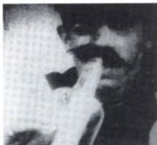
Ecuador. "El ronco", en El terror de la frontera , 1929. Dirigida por Luis Martínez Quirola.