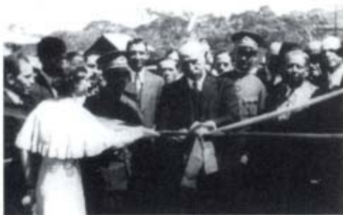
Costa Rica. Inauguración de obra pública por el presidente Ricardo Jiménez. 1930 - 35.