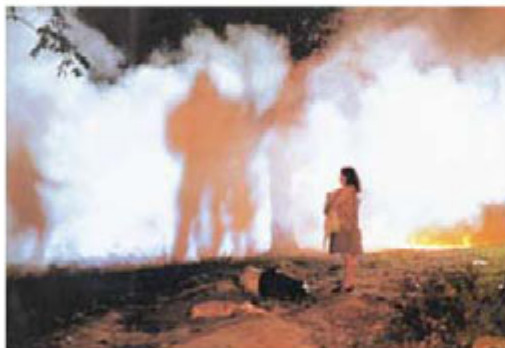
La primera noche (2008), de Luis Alberto Restrepo, sobre una pareja de desplazados que llega a Bogotá, fue reconocida con varios premios internacionales. (Archivo Fundación Patrimonio Filmico Colombiano).

En 2003 también salieron a salas Hábitos sucios (Carlos Palau), La primera noche (Luis Alberto Restrepo) y El carro . Hábitos llevó a la pantalla una historia basada en hechos reales ocurridos en un convento de mujeres, con un asesinato de por medio, mezclado con intrigas y asedios sexuales entre las compañeras religiosas. En La primera noche , dos desplazados de la violencia paramilitar llegan a Bogotá, obligados a reconstruir los hilos rotos del pasado dejado