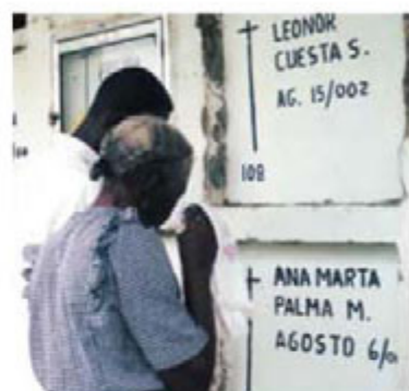
Una casa sola se vence (2004), de Marta Rodríguez, quien continúa haciendo documentales en los que denuncia las aberraciones del conflicto colombiano.

En el primer caso se trató del reconocimiento a una película de pequeño presupuesto para los estándares de Estados Unidos, coproducida entre ese país