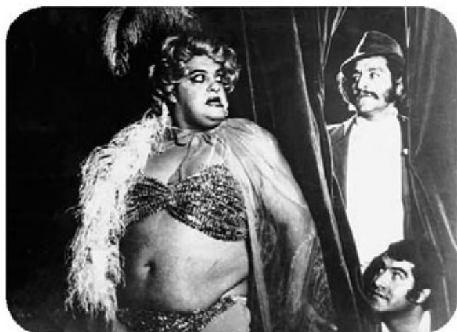
El taxista millonario (1979)

Al margen de estas discusiones o anticipándose a ellas, una película como Camilo, el