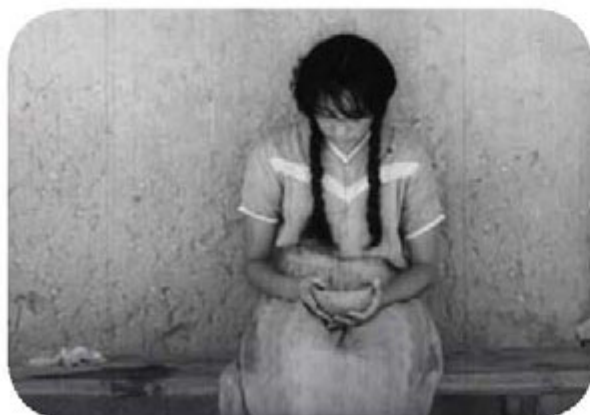
Tres cuentos colombianos (1968).