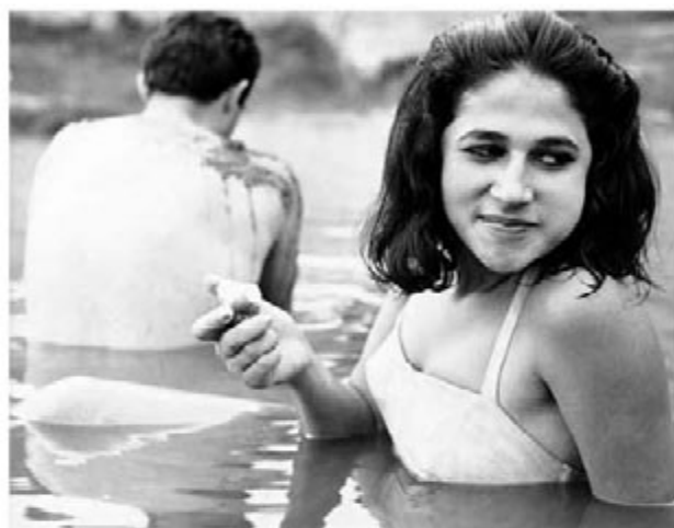
Pasado el meridiano (1966).

A pesar de la censura a Raíces de piedra , que durante dos años impidió la comercialización de la película – exhibida finalmente con nuevas escenas suprimidas –, Arzuaga terminó un nuevo largometraje en 1966: Pasado el meridiano , con el que se repitieron los incidentes con una censura cuyas características y modus operandi se verán más adelante. La película describe el viaje del ascensorista de una agencia de publicidad hasta el pueblo donde murió su madre. “Es la interiorización de un personaje – escribe Luis Alberto Álvarez –, una jornada hacia sí mismo, como en Antonioni por aquellos mismos años. Pero no es un personaje prestado del cine europeo, sino un colombiano medio, tal vez el primer arquetipo del colombiano presente