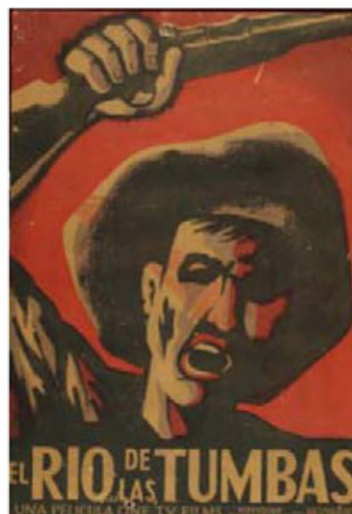
El río de las tumbas (1965).

Finalmente, los trabajos de Gabriela Samper se pueden considerar pioneros de una aproximación