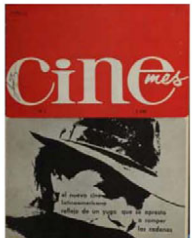
Revista Cinemés , 1965