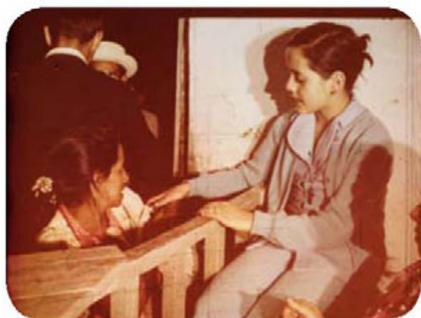
El cuento que enriqueció a Dorita (1974).

Este mismo crítico, en su citada Historia del cine colombiano destaca cortometrajes como El oro es triste (1972), La patria boba (1972) y El cuento que enriqueció a Dorita (1974) de Luis Alfredo Sánchez, Yo pedaleo, tú pedaleas (1974) de Alberto Giraldo y con guión de Lisandro Duque, o Corralejas (1974) de Ciro Durán y Mario Mitrotti, por su capacidad de generar polémica y reacciones en el público como consecuencia de su estilo directo, con trasfondo político y de alto impacto emocional. Incluso un corto como Asunción (1975) de Ospina y Mayolo, chocó de nuevo con la censura por su carácter corrosivo. Pero la mentalidad predominante fue de oportunismo estético y económico. Algunos cortometrajes de sobreprecio emplearon, a la ligera, una especie de método crítico-social, con profusión de toda suerte de miserias humanas mezcladas con datos estadísticos y proclamas de buena voluntad. Esta estética fue puesta en evidencia por el cortometraje