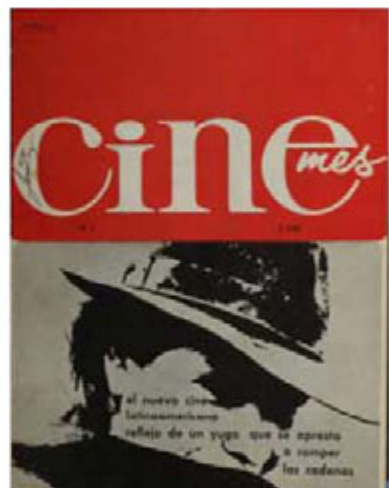
Revista Cinemés , 1965