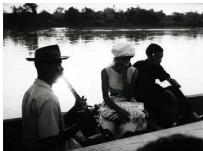
Tierra amarga (1965).