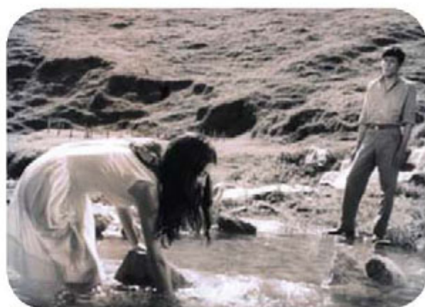
Bajo la tierra (1968).