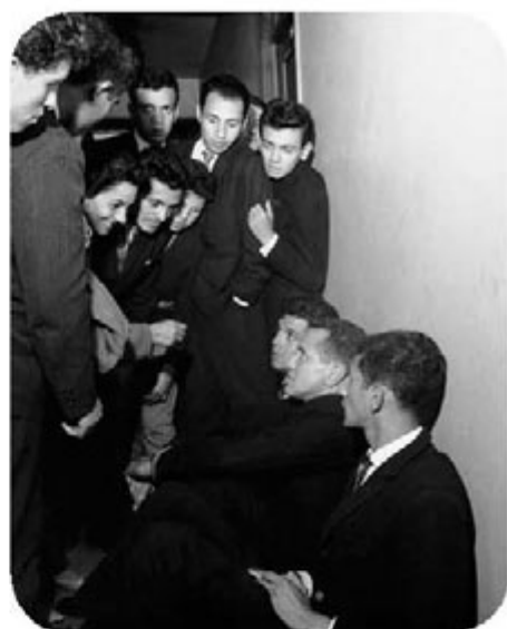
Camilo, el cura guerrillero (1974).

cura guerrillero (Norden, 1974) polarizó las opiniones entre quienes privilegiaban un sentido político del cine y los que aspiraban a públicos más amplios. Para los primeros, la película era evasiva y poco comprometida al presentar un Camilo Torres a la medida de la burguesía (casi todos los entrevistados que arman el rompecabezas de Camilo dentro del documental pertenecían a ella). Para los segundos, entre quienes se contó Hernando Valencia Goelkel, la película era un camino claro a seguir: "Es la primera obra importante que produce el cine nacional. Es, fuera de esa significación doméstica, un documento maravilloso, organizado, claro, sobrio, elegantemente subversivo" 34 .